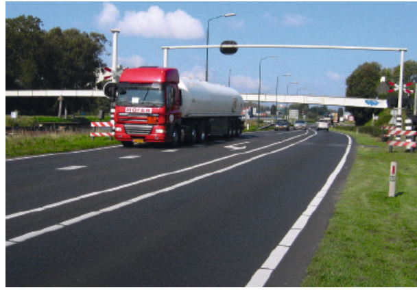
Abbildung 3: Dünne Asphaltdeckschicht auf Betondecke in den Niederlanden

Die guten Ergebnisse, insbesondere im Hinblick auf die Lärminderung, führten 2012 im Zuge der zirka 22 km langen Bestandserneuerung der Nordfahrbahn der A93 von Kiefersfelden bis zum Inntaldreieck zur Entscheidung, auch dort Beton und Asphalt zu kombinieren.