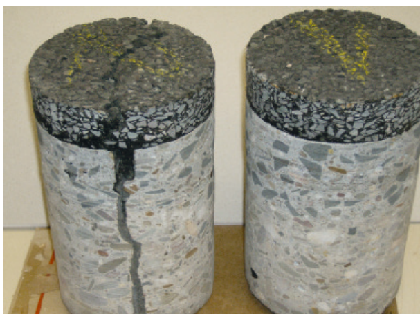
Abbildung 5: Bohrkern «Dünne Asphaltbeläge auf Beton»

Eine Abschätzung der Neubaukosten in einem Sachstandsbericht des Vereins Deutscher Zementwerke zeigt, dass die Herstellungskosten der Kombinationsbauweise nur geringfügig über den Kosten der klassischen Einzelbauweisen liegen. Dadurch wird die Kombination Asphalt auf Beton bereits im Neubau wirtschaftlich konkurrenzfähig. Betrachtet man eine Nutzungsdauer von 30 bis 50 Jahren bis zur nächsten grundhaften Erneuerung, ist die Kombinationsbauweise wesentlich wirtschaftlicher, sicherer und innovationsfreundlicher als die Einzelbauweisen.