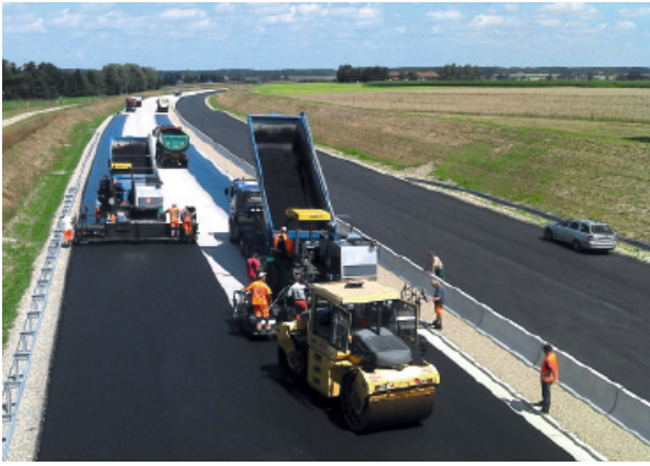
Abbildung 2: Guter Verbund zwischen Asphalt und Beton auf der A94