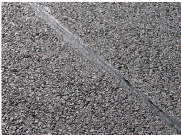
Abbildung 4: Asphaltdeckschicht, nur 1 cm dick, lärmreduziert, mit vergossener Fuge