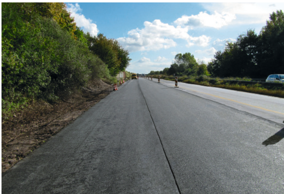
Abbildung 1: Lärmarmere dünnschichtiger Asphaltbelag auf Beton, A61

Eine Erprobung größeren Umfanges erfolgte im Jahre 2011 beim Neubau des Teilstücks Forstinning–Pastetten auf der A94 München–Passau. Hier wurden jeweils 4 km unbewehrte und durchgehend bewehrte Betondecken unmittelbar nach der Herstellung mit einem nur etwa 12 mm dicken DSH-V-Belag überbaut (Abbildung 2).